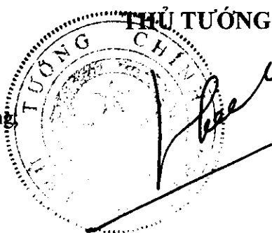
Nguyễn Xuân Phúc